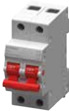
MCB 5TE3 2P