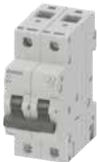
MCB 5TJ 2P