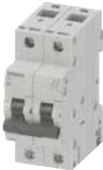
MCB 5TJ 2P