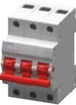
MCB 5TE3 3P