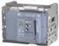
ACB 3WJ withdrawable ACB 3WJ loại rút kéo