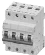
MCB 5TJ 4P