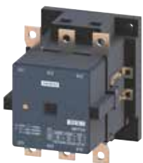
3MT7 size 5, 6, 7, 8

Note: For other control voltage of contactor coils (Us), please contact us