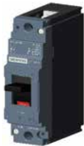
MCCB 3VJ 1P

MCCB 3VJ có chức năng đóng cắt mạch điện, bảo vệ ngắn mạch và quá tải. MCCB 3VJ lên đến 630A, dòng cắt ngắn mạch từ 10 đến 55kA tại 415V AC Bảo vệ theo nguyên lý từ nhiệt Tiêu chuẩn IEC / EN 60947-2