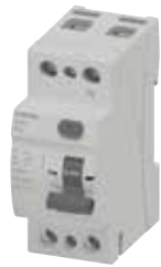
RCBO 5TJ7 2P

Bảo vệ chống dòng rò. Cần phối hợp với MCB. Tiêu chuẩn IEC 61008-1, IEC 61008-2-1