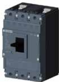
MCCB 3VJ 2P