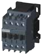
3MT7 size 0, 1