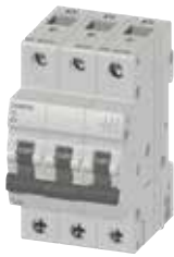
MCB 5TJ 3P