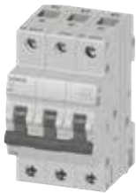
MCB 5TJ 3P