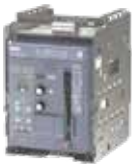
ACB 3WJ fixed-mount ACB 3WJ loại gắn cố định