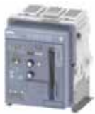
ACB 3WJ fixed-mount ACB 3WJ loại gắn cố định