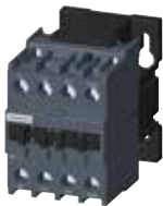
3MT7 size 2