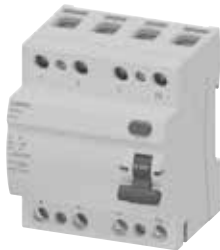
RCCB 5TJ7 4P