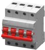
MCB 5TE3 4P

(*) Price to be advised - Liên hệ với Siemens để được báo giá