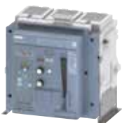
ACB 3WJ fixed-mount ACB 3WJ loại gắn cố định