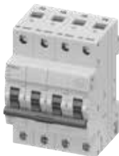
MCB 5TJ 4P