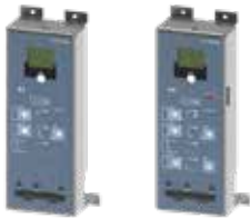
3WJ trip unit