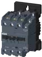
3MT7 size 3, 4